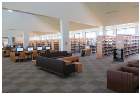
図書館・ラウンジ