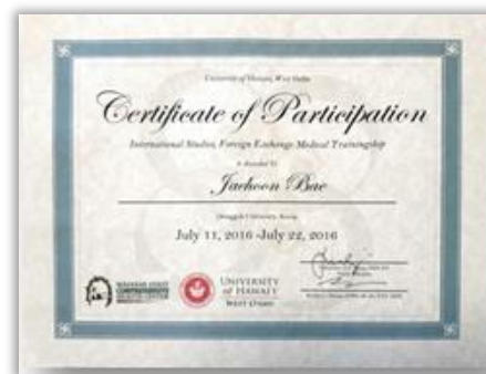
ハワイ大学 短期特別プログラム 修了証明書